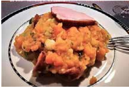
Möhrengemüse mit Frikadellen